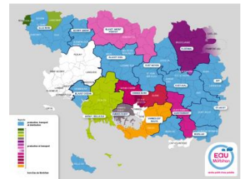
224 communes adhérentes en Production Transport et 113 communes adhérentes en Distribution (en bleu)

La population desservie est de 215 539 habitants .