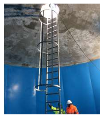
Rénovation de réservoir (Barenton à Malestroit)

Dépenses d'équipement réalisées en 2017 : 5 134 000 €