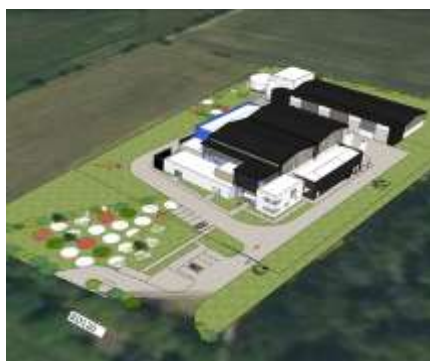
Projet d'Unité de Production de Tréaray 2 (Sainte-Anne-d'Auray)

Report des excédents d'investissement cumulés sur les exercices antérieurs