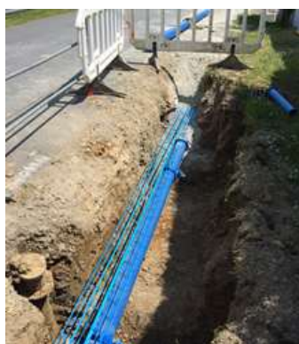
Renouvellement de réseau (Carentoir)

Les recettes du Budget Distribution proviennent principalement des ventes d'eau aux abonnés du service (uniquement sur le périmètre où Eau du Morbihan exerce la compétence Distribution) et les investissements sont financés en grande partie par l'emprunt.