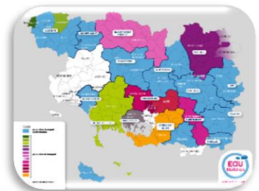
224 communes adhérentes en Production Transport et 113 communes adhérentes en Distribution (en bleu)